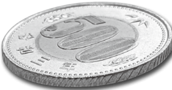
【写真2】2021年 日本 新500円