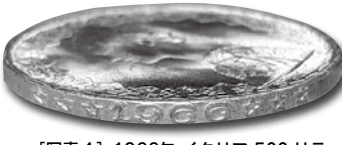
【写真4】1966年 イタリア 500リラ