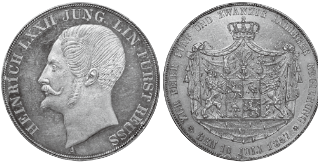
【写真5】1847年 ロイス ハインリヒ 72 世 在位 25 周年記念2ターラー

例えばこの一八四七年ロイスハインリヒ七二世 在位二五周年記念2ターラー【写真5】。