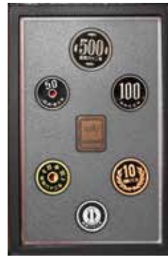
通常貨セット (縮小)