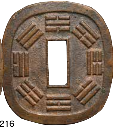
6216 秋田鑄錢 短尾 6217 秋田鑄錢 短尾