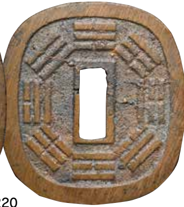
6220 秋田鑄錢 長尾 肥紋 6221 秋田鑄錢 長尾