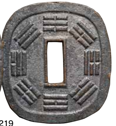
上 ¥5,000 上 ¥5,000