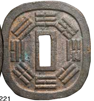
上 ¥10,000 美 ¥7,000