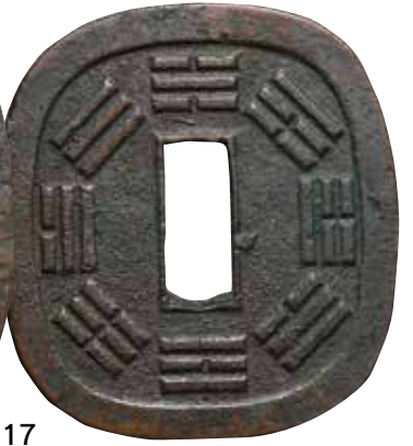
美 ¥6,000 上 ¥5,000