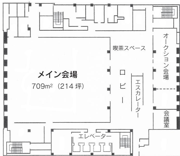
日本橋プラザ会場平面図