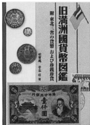
旧満州國貨幣図鑑