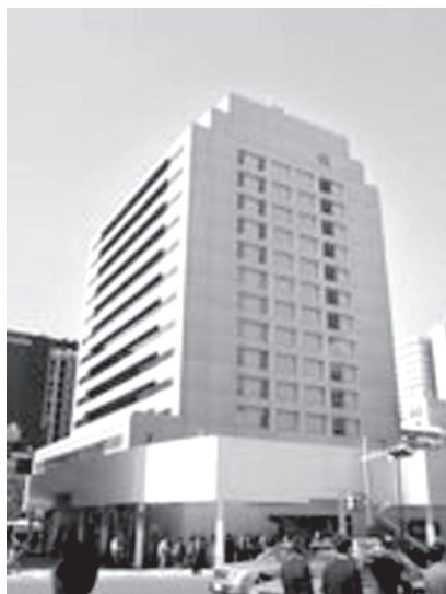
日本橋プラザ全景

二〇二二年CCCF(コイン・コレクション・フェア)は「日本橋プラザ」三階で開催致します。会場の周辺地図を下に掲げます。本フェアの各出店業者様の販売品目録は巻