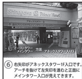
⑥ 右矢印がアネクスタワー1F入口です。アーチを抜けて左矢印を進むと正面にメインタワー入口が見えてきます。