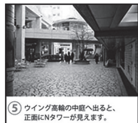
⑤ ウイング高輪の中庭へ出ると、正面にNタワーが見えます。