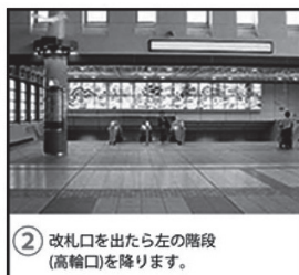
② 改札口を出たら左の階段(高輪口)を降ります。