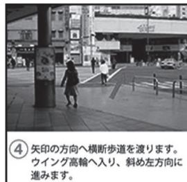
④ 矢印の方向へ横断歩道を渡ります。ウイング高輪へ入り、斜め左方向に進みます。