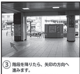
③ 階段を降りたら、矢印の方向へ進みます。