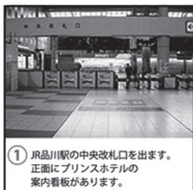
① JR品川駅の中央改札口を出ます。正面にプリンスホテルの案内看板があります。