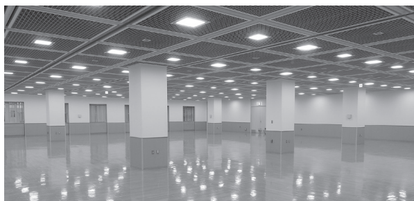
日本橋プラザ会場平面図(上)とメイン会場イメージ(下)

ルほどの道のりです。前方の目印として丸善日本橋店や日本橋高島屋がありますので、道に迷うことはまずないと思います。