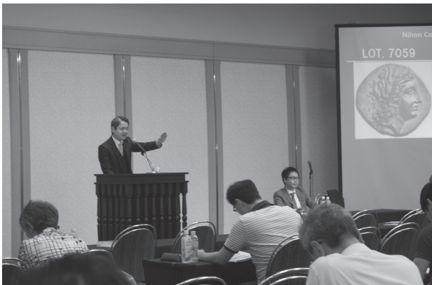
昨年の様子（上：即売会場、下：オークション会場）

としては、一月に名古屋で開催された第42回世界の貨幣まつり（於・ウインクあいち）では、テレビ報道の影響もあり、平成31年銘のミントセット目当てに当日急遽整理券が配布されるほど多くの方が来場さ