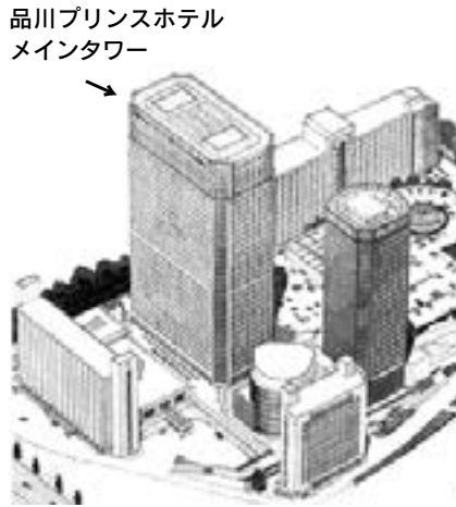
会場外観 (左下が品川駅)

二〇一七年CCF(コイン・コレクション・フェア)は、「品川プリンスホテル」メインタワーで開催致します。ホテルの外観図と周辺地図を再度掲げます。