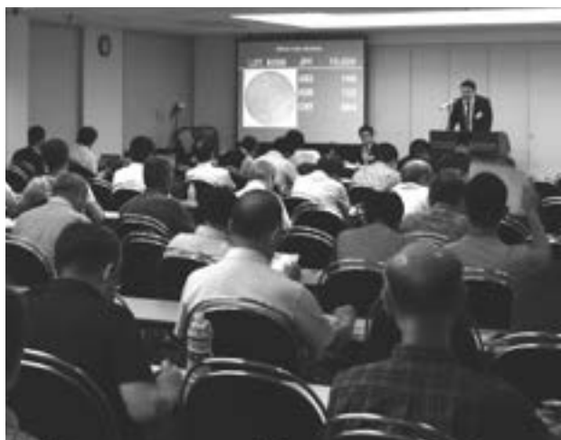
昨年のオークション会場の様子

せる形で改訂版を出したいと考えております。今年はその編集作業に注力するということ、例会は開かないということになりました。改訂版は来年のCCCFに出せるように進めて参ります。しばらくお待ちいただければ幸いです。右のような事情のため、今年の研究会は日本近代銀貨研究会のみとなります。詳しい当日のスケジュールや内容は次号でご案内致します。