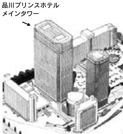
品川プリンスホテル メインタワー