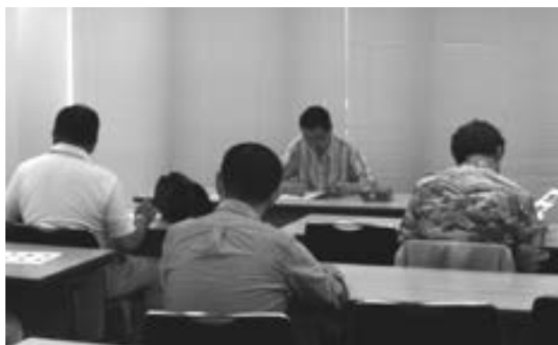
昨年の研究会会場の様子